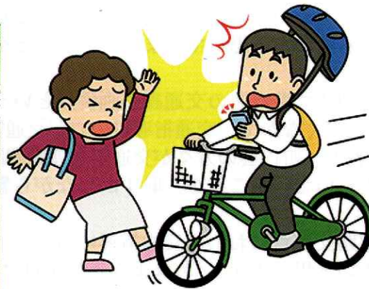
ながらスマホはしない！